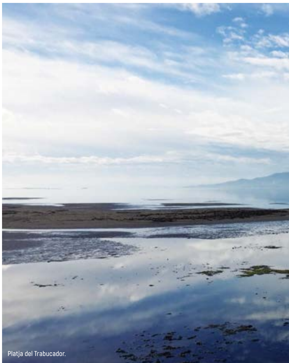
Platja del Trabucador.

Llegamos a Las Salinas, al lado de San Pedro de Pinatar y aparcamos en el parking de la marina deportiva, estamos muy tranquilos y con buena vista, además hay un bar que nos ha dicho que cierra tarde y abre a las ocho de la mañana,