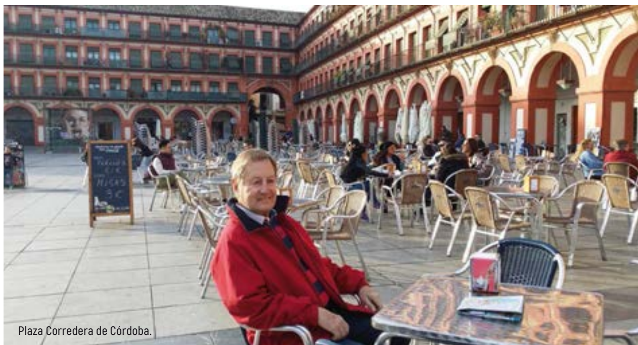
Plaza Corredera de Córdoba.

Dos ciudades sorprendentemente bonitas con edificios importantes de la Edad Media.