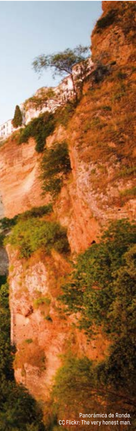
Panorámica de Ronda.